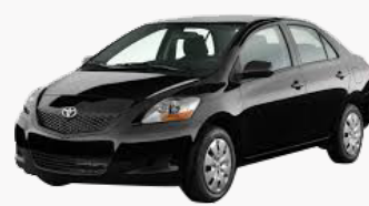
Toyota Yaris 2013