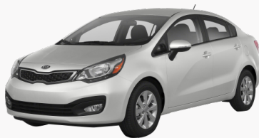
Kia Río 2013

Si tu carro es un Kia Río 2013, dentro del grupo de carros similares características a este encontramos a Hyundai Accent 2013, Toyota Yaris 2013, Kia Cerato 2013.