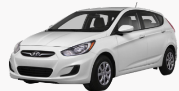
Hyundai Accent 2013

*Este ejemplo es referencial. La disponibilidad de los carros dependerá de la oferta del mercado en la fecha de ocurrido del robo.